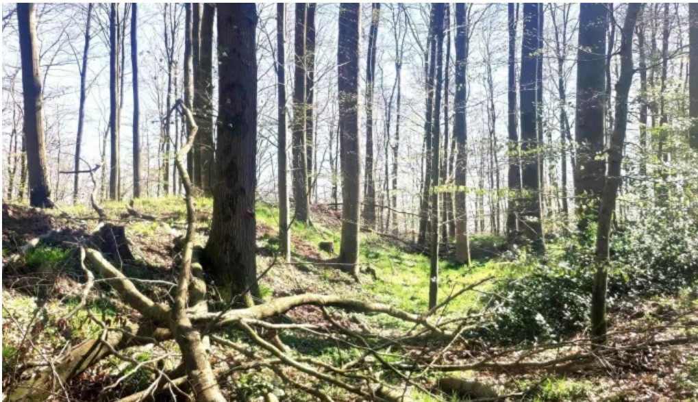
Alte burg behrendorf