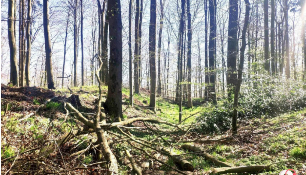
Alte burg alle