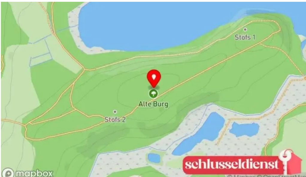
Alte burg karte