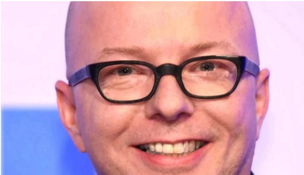
Alte burg bewertung