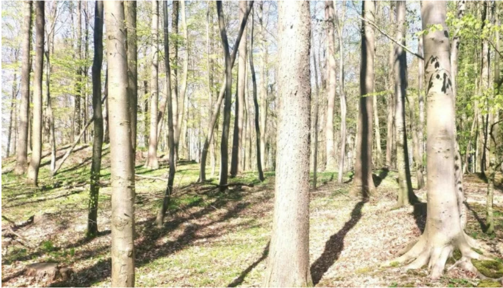
Alte burg schloss