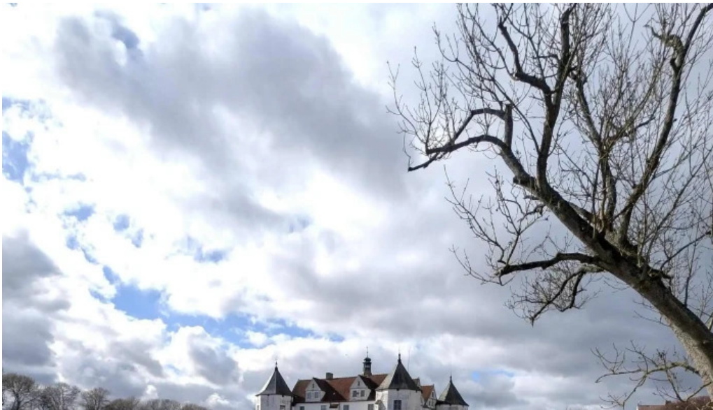
Schloss glucksburg telefon