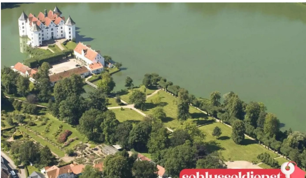
Schloss glucksburg vom inhaber