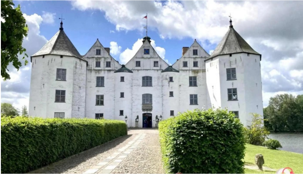
Schloss glucksburg garten