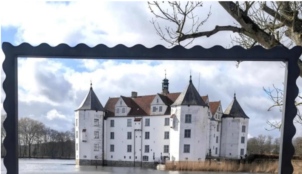
Schloss glucksburg bewertung