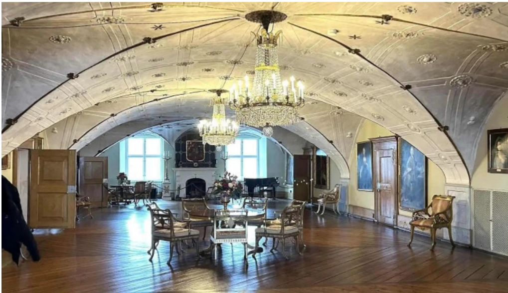
Schloss glucksburg glucksburg ostsee