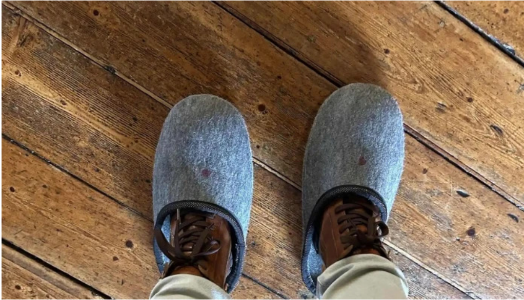
Schloss glucksburg schloss