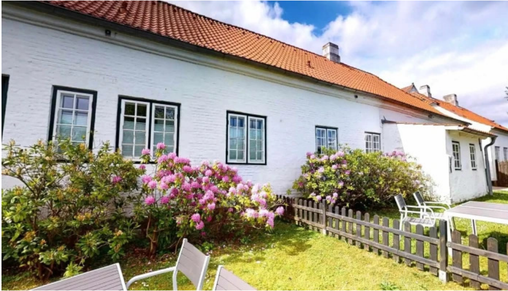
Schloss glucksburg street view 360deg fotos