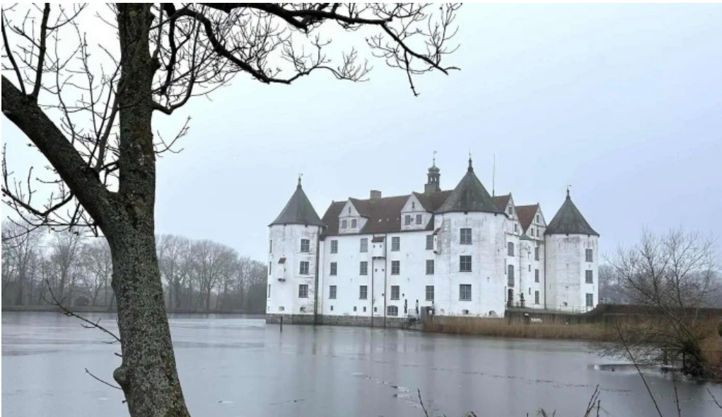
Schloss glucksburg kommentare