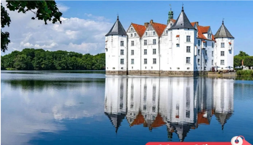
Schloss glucksburg alle