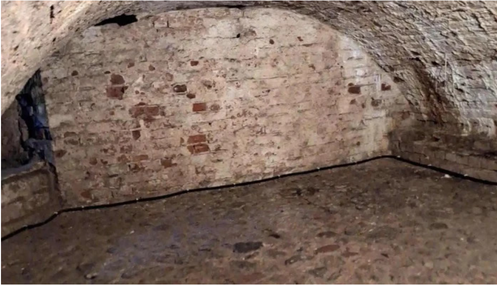
Schloss glucksburg neueste