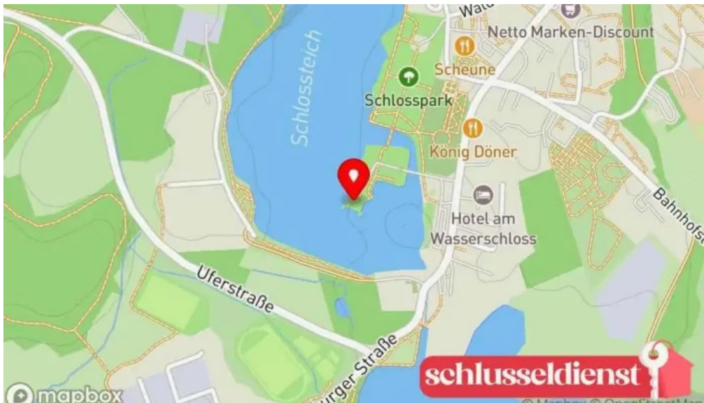
Schloss glucksburg karte