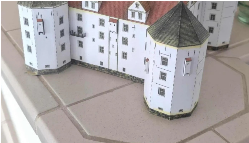
Schloss glucksburg offnungszeiten