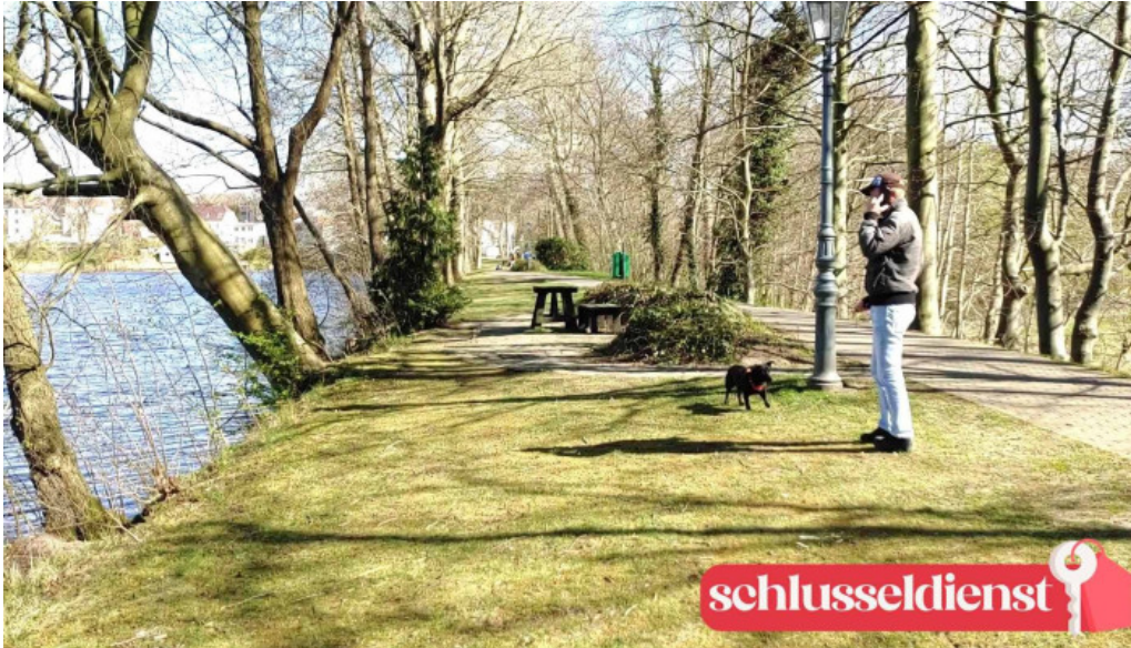
Schloss glucksburg videos